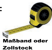
Maßband oder Zollstock